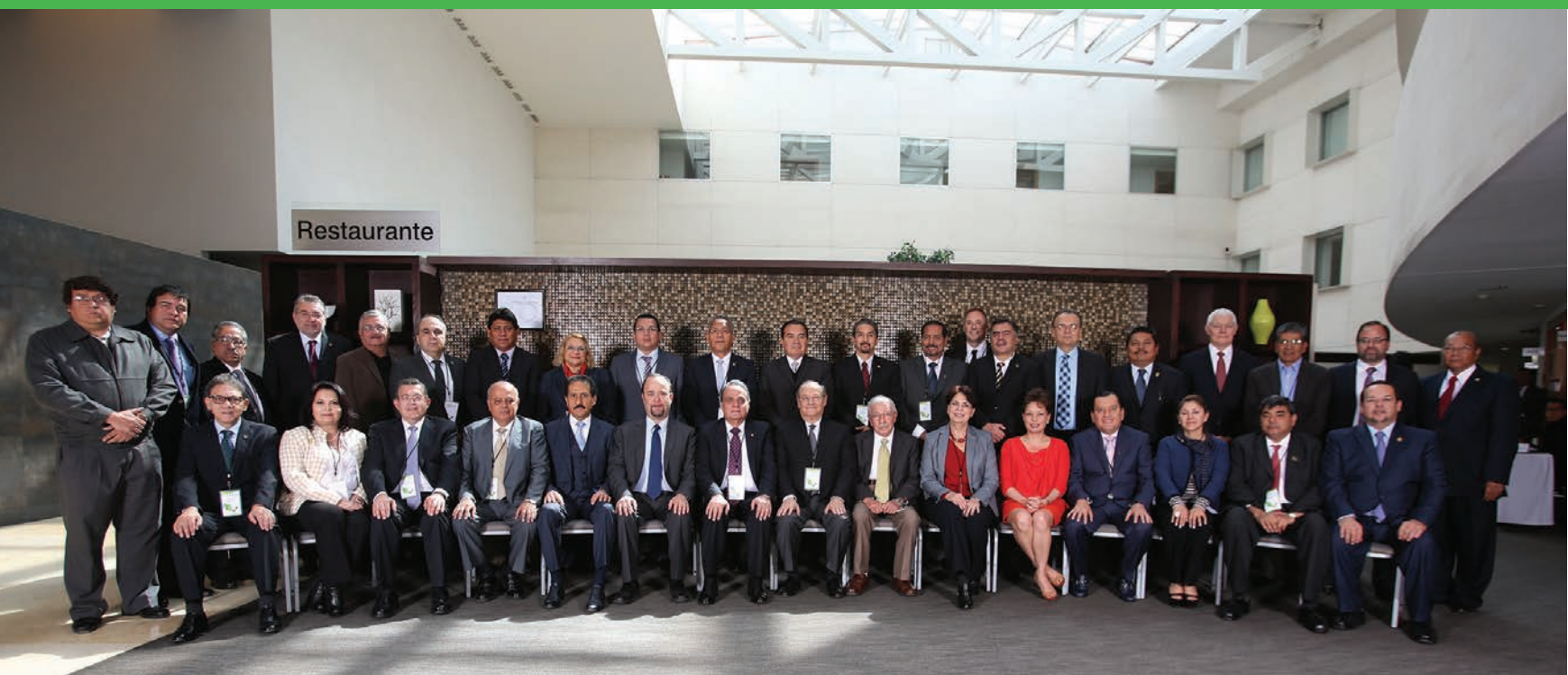
Primera Sesión Ordinaria del Consejo de Rectores 2015